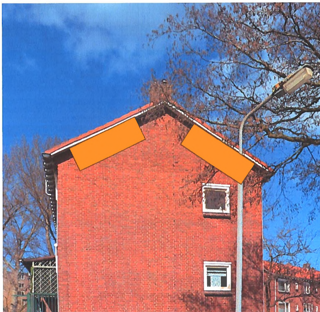
Figuur 1: Op de plekken van de gele rechthoeken dienen de voorzieningen aangebracht te worden aan de Landzichtlaan 12 en 22 te Krommenie.