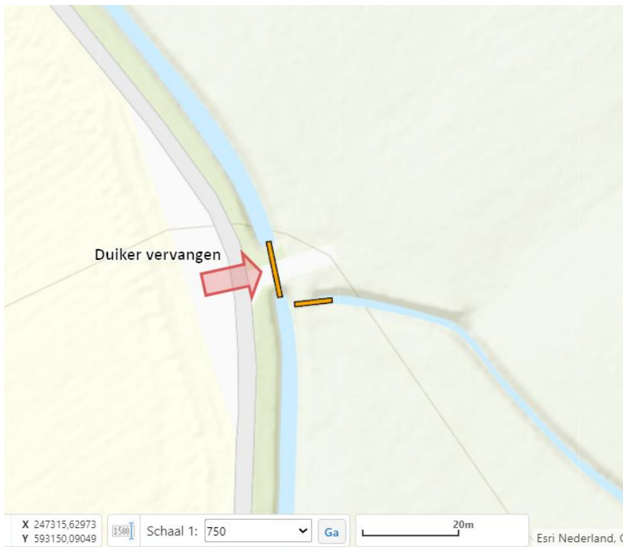
Figuur 2: Overzichtskaart van de werkzaamheden.

De vergunningaanvraag is bij waterschap Noorderzijlvest geregistreerd onder het zaaknummer Z/24/075847. De aanvraag omvat de volgende voor dit besluit relevante stukken: