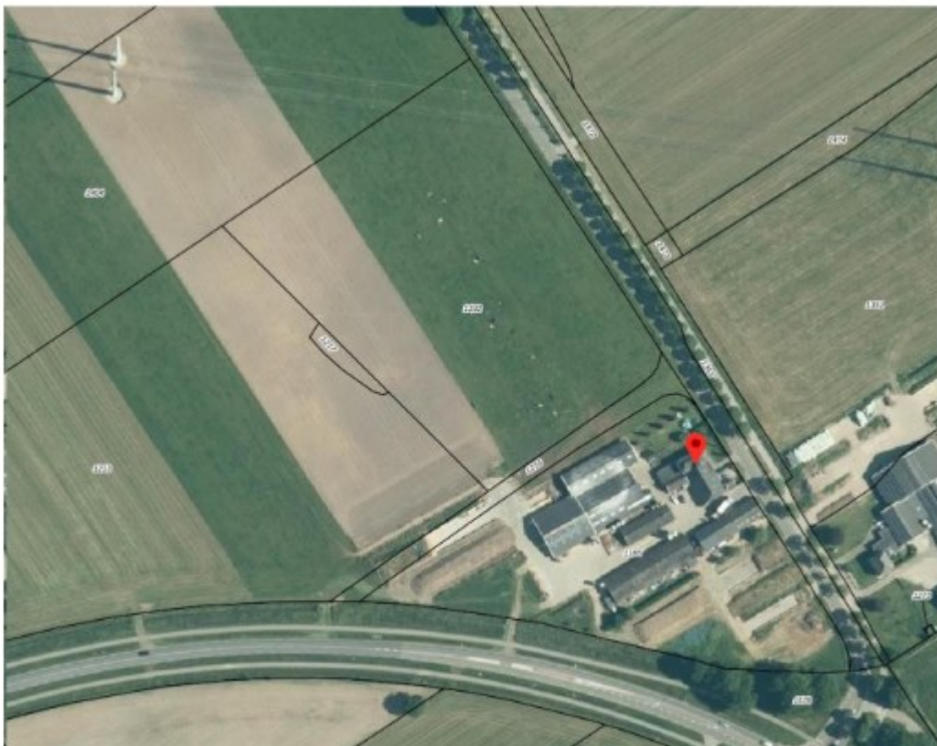
Figuur 1: Kadastrale aanduiding 1216, 1192, 1217 en 1213 gebruikt voor weidegang.