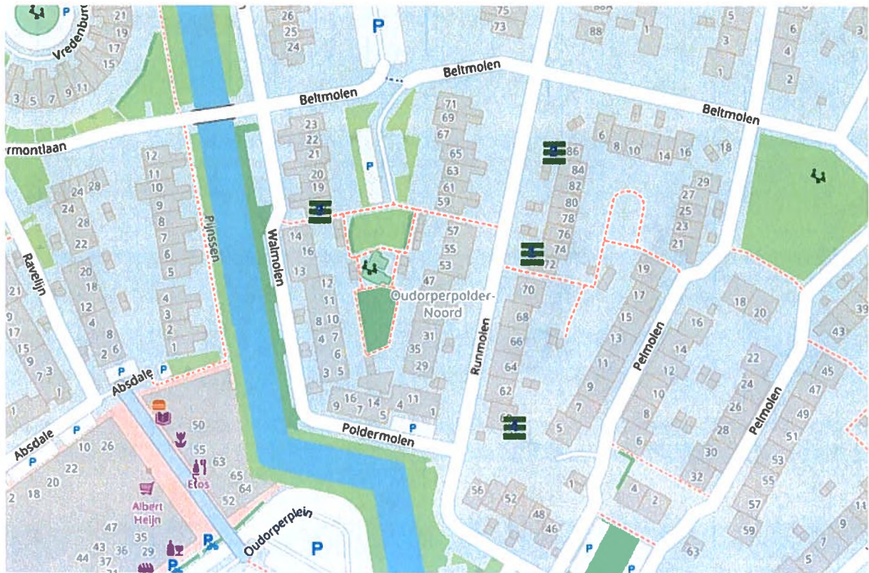
Figuur 1: Locaties van de vier tijdelijke kraamverblijfplaatsen voor de gewone dwergvleermuis.