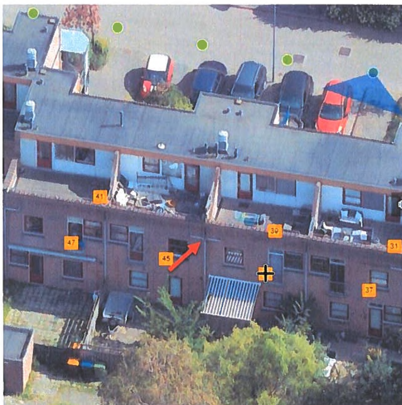
Figuur 2: Exacte locatie van de waargenomen kraamverblijfplaats van de gewone dwergvleermuis (oranje pijl).