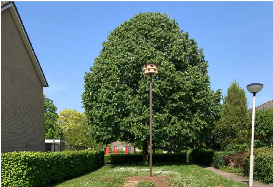
Figuur 4. Tijdelijke mitigatie voor huismus in de vorm van een huismustil.