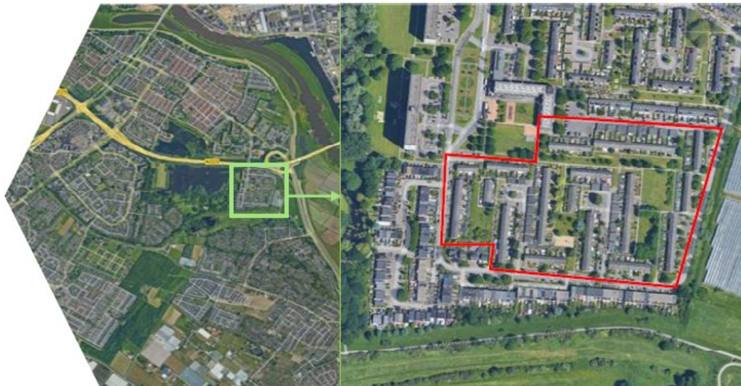
Figuur 1. Ligging van het plangebied met links de ligging binnen de regio en rechts binnen het rode kader de begrenzing van het plangebied.