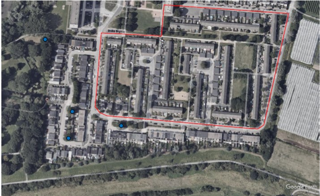
Figuur 3. Locatie van 4 extra bolle kasten aan bomen voor de ruige dwergvleermuis.