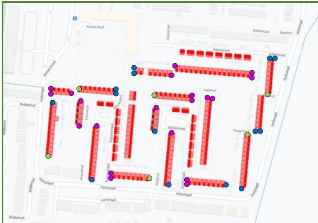
Figuur 9: Overzicht plangebied met het te renoveren woningen (rood gearceerde woningen) en de locaties/gevels van de aan te brengen permanente kasten.