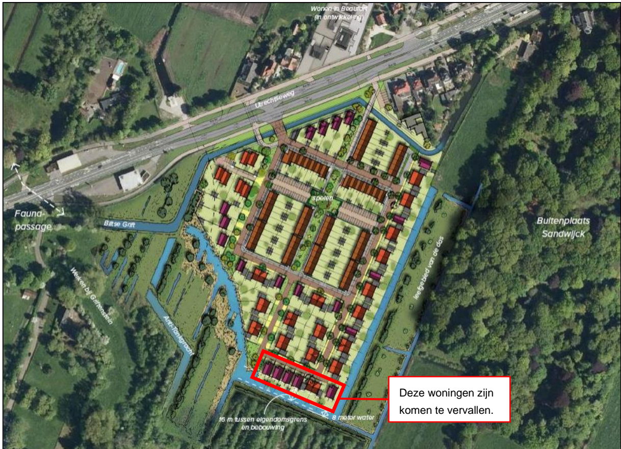
Figuur 2: Indicatieve situatietekening