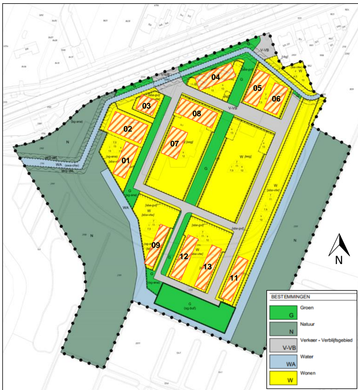
Figuur 1: Uitsnede plankaart met naamgeving bouwvlakken