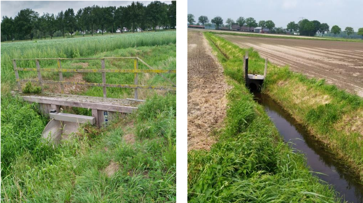
Figuur 2: Foto's van twee stuwlocaties waar werkzaamheden zijn gepland (links: omgeving Meinweg-Roerdal, rechts: omgeving Grote Peel)

Alle werkzaamheden zullen plaatsvinden op de locaties van de bestaande stuwen. Ter plaatse van de stuwen waar de meer ingrijpende werkzaamheden zijn gepland (o.a. het vervangen van het damwandscherm), zal worden gewerkt binnen de bestaande greppels (zie figuur 2). Hier heeft daarom al grondroering plaatsgevonden tot onder de archeologisch relevante bodemlagen. De omvang van de voorgenomen graafwerkzaamheden per locatie blijft ook beperkt, tot ca. 15 m 2 per stuw.