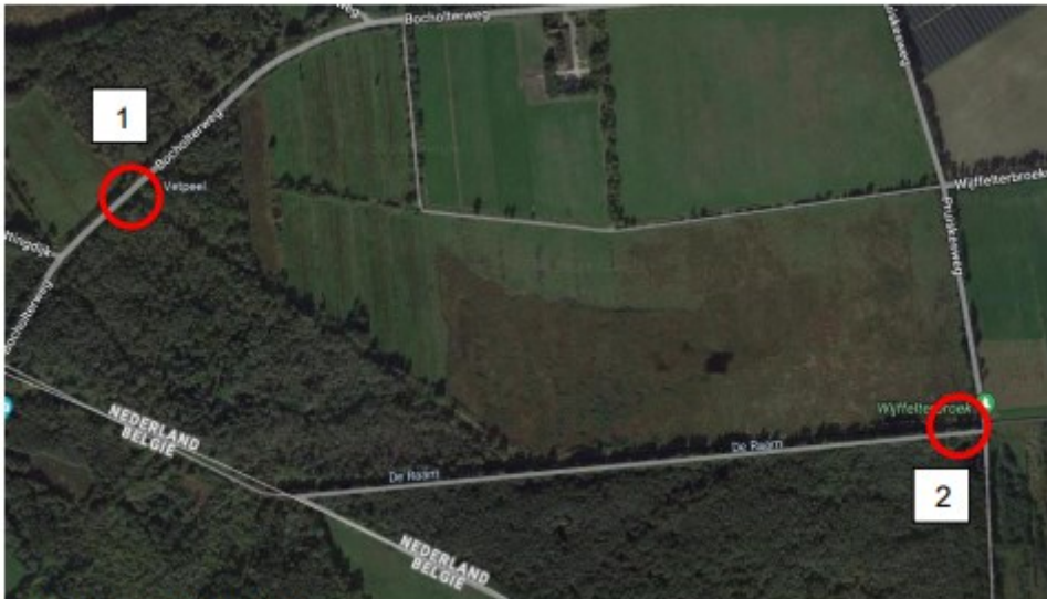
Figuur 2.1: Ligging locaties