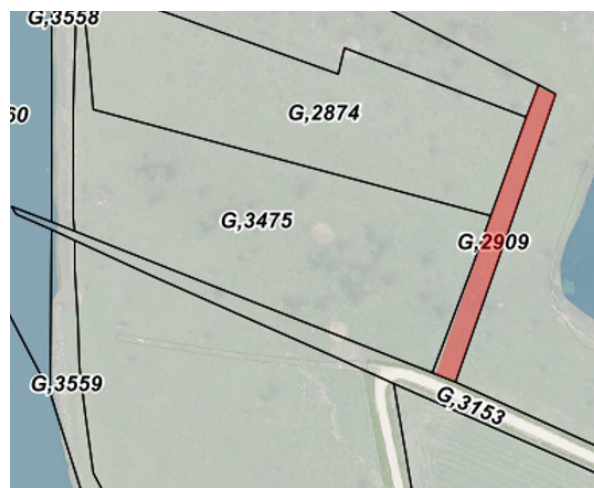
2 e Drakenweg

Uit voorgaand kaartmateriaal en luchtfoto's blijkt dat de 2 e Drakenweg sinds 2010 niet meer openbaar toegankelijk is en afgesloten is middels palen en puntdraad. Heden is de 2 e Drakenweg feitelijk niet meer toegankelijk en herkenbaar als een weg of pad. De 2 e Drakenweg wordt nu formeel op basis van artikel 7 en 9 van de Wegenwet aan de openbaarheid onttrokken, zoals weergegeven in de onderstaande afbeelding: