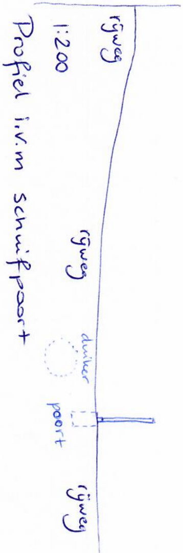
Profiel i.v.m. schuifpoort