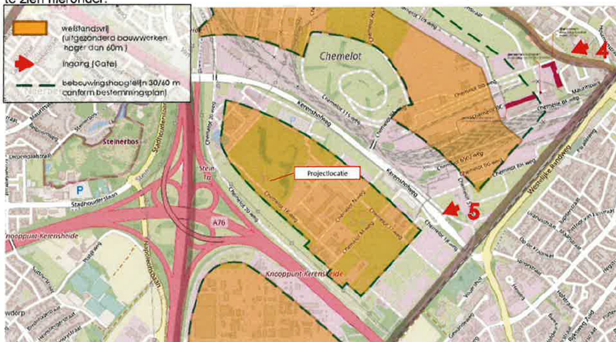
Afbeelding 1 welstandsvrij gebied

Een uitsnede van de digitale kaart van het gebied waar het onderhavige bouwwerk wordt gerealiseerd is te zien hieronder.