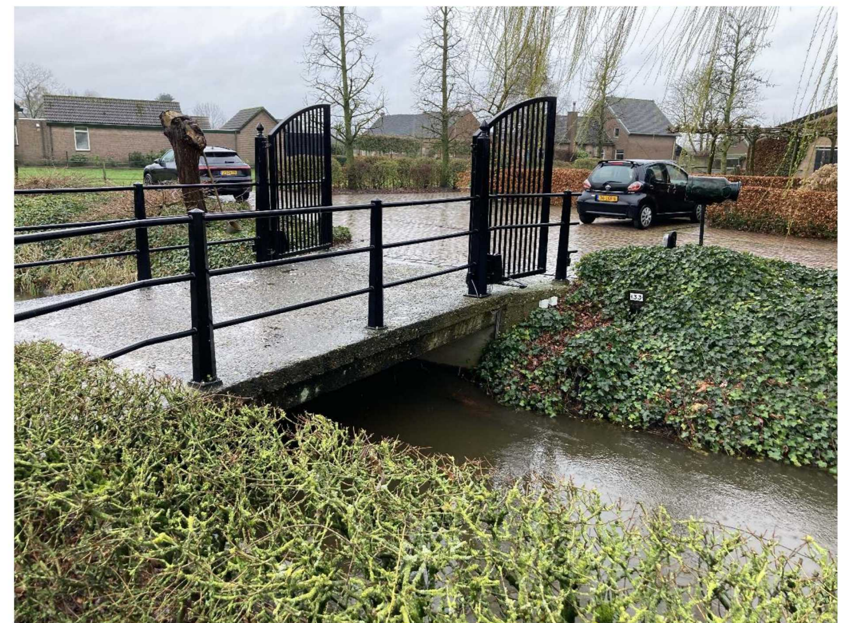
Foto 3 bestaande brug