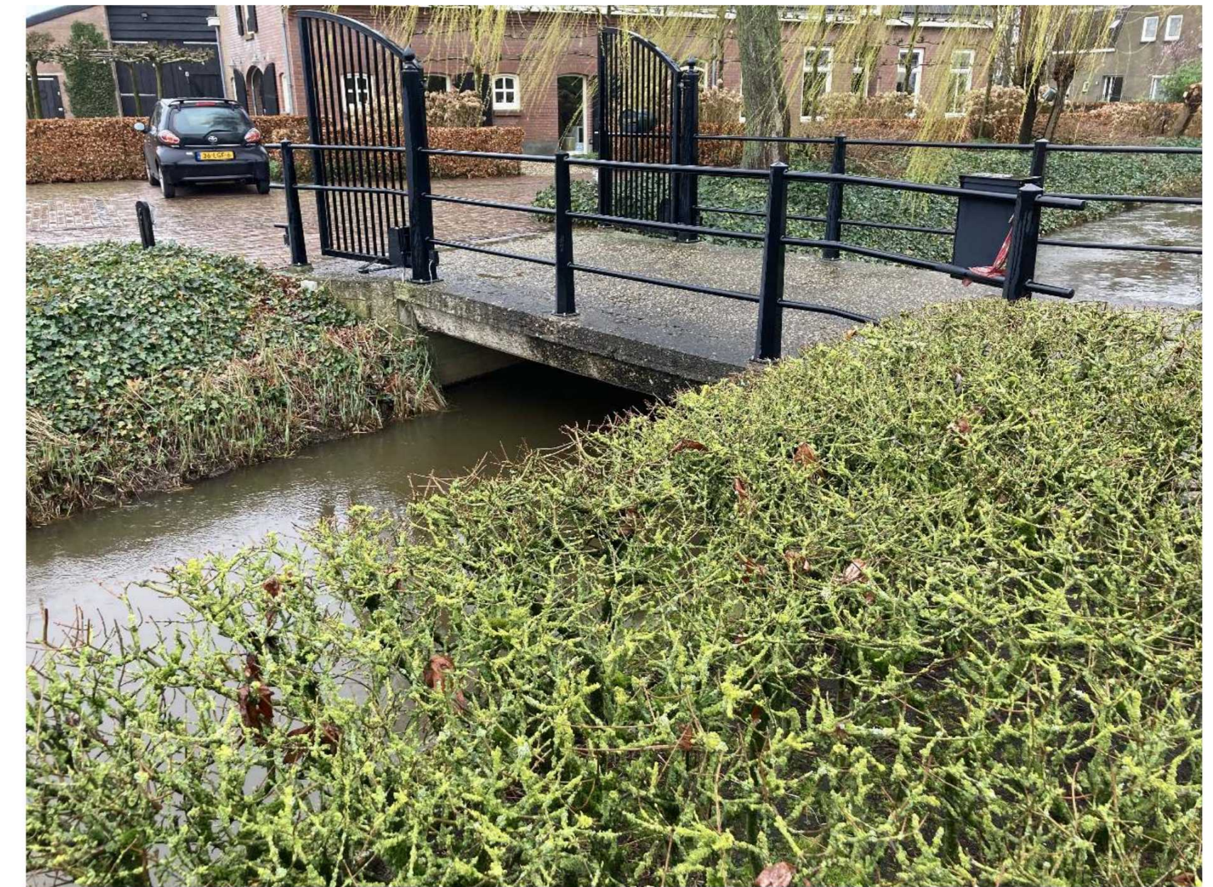
Foto 2 bestaande brug