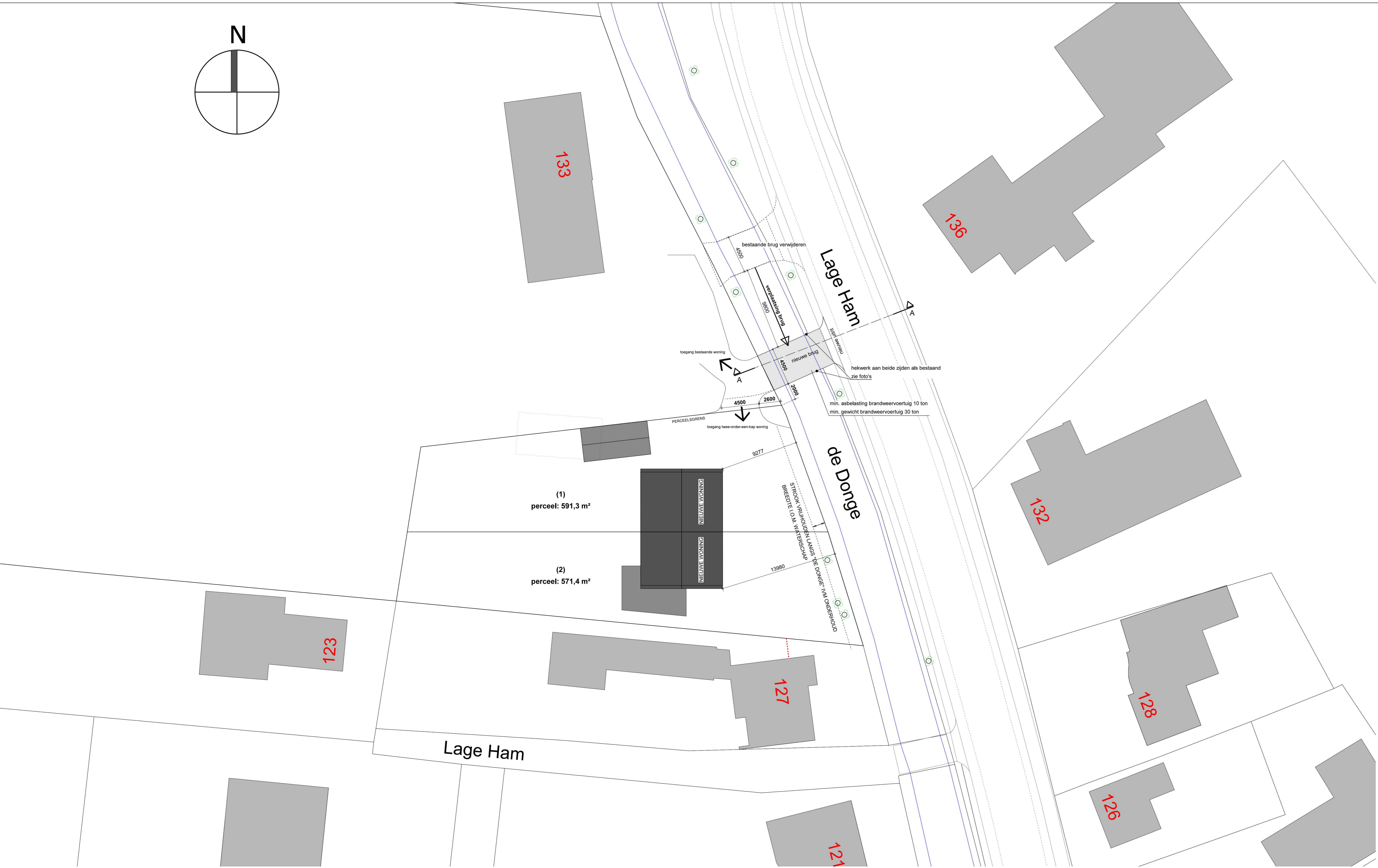
Situatie schaal 1:200