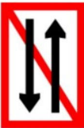
A.4 Ontmoeten en voorbijlopen verboden