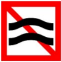
A.9 Verboden hinderlijke waterbeweging te veroorzaken