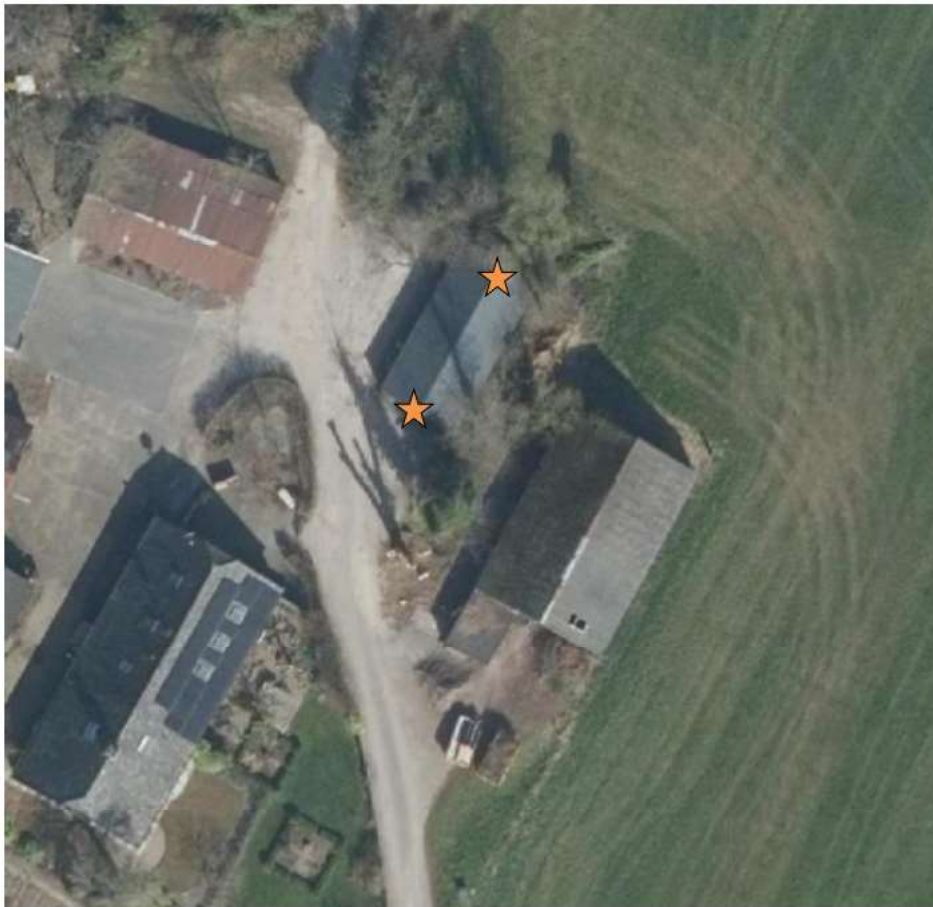
Figuur 1. Locaties van de twee permanent beschikbare nestkasten, geplaatst ter mitigatie en compensatie van de rustplaats van de kerkuil. De te slopen veestal bevindt zich rechtsonder ten opzichte van de schuur met de geplaatste maatregelen.

"12) In het activiteitenplan ontbreken de precieze locaties van de aangebrachte maatregelen ter mitigatie en compensatie voor de verblijfplaats van de kerkuil. Wij verzoeken deze op een kaart van het plangebied alsnog aan te leveren, inclusief beeldmateriaal van de aangebrachte maatregelen."