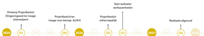
Figuur 4. Planning deelproject Kwistbeek

De planning van het deelproject herstel Kwistbeek is op hoofdlijnen in figuur 4 weergegeven. Deze planning is op hoofdlijnen en er kunnen geen rechten aan worden ontleend.