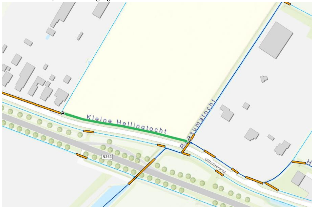
Figuur 2: in groen en met A-A weergegeven af te waarderen primaire watergang