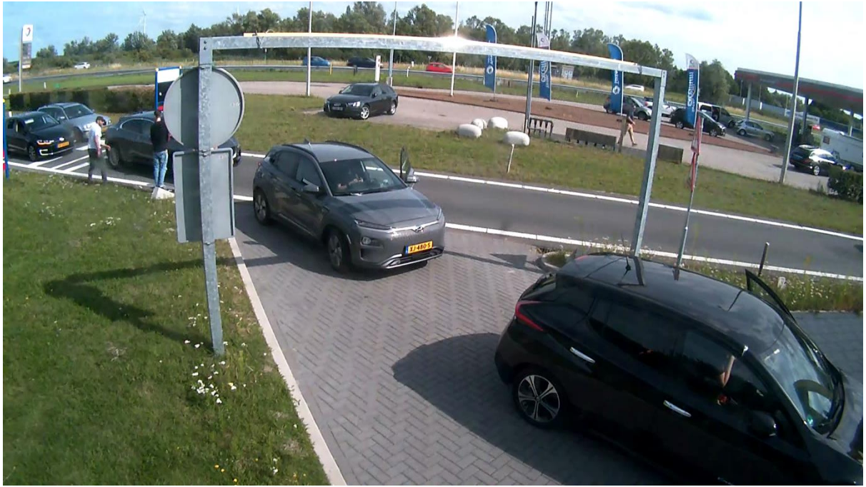
Wachtrij op locatie Aalscholver, met al meerdere stilstaande voertuigen op de doorgaande weg.