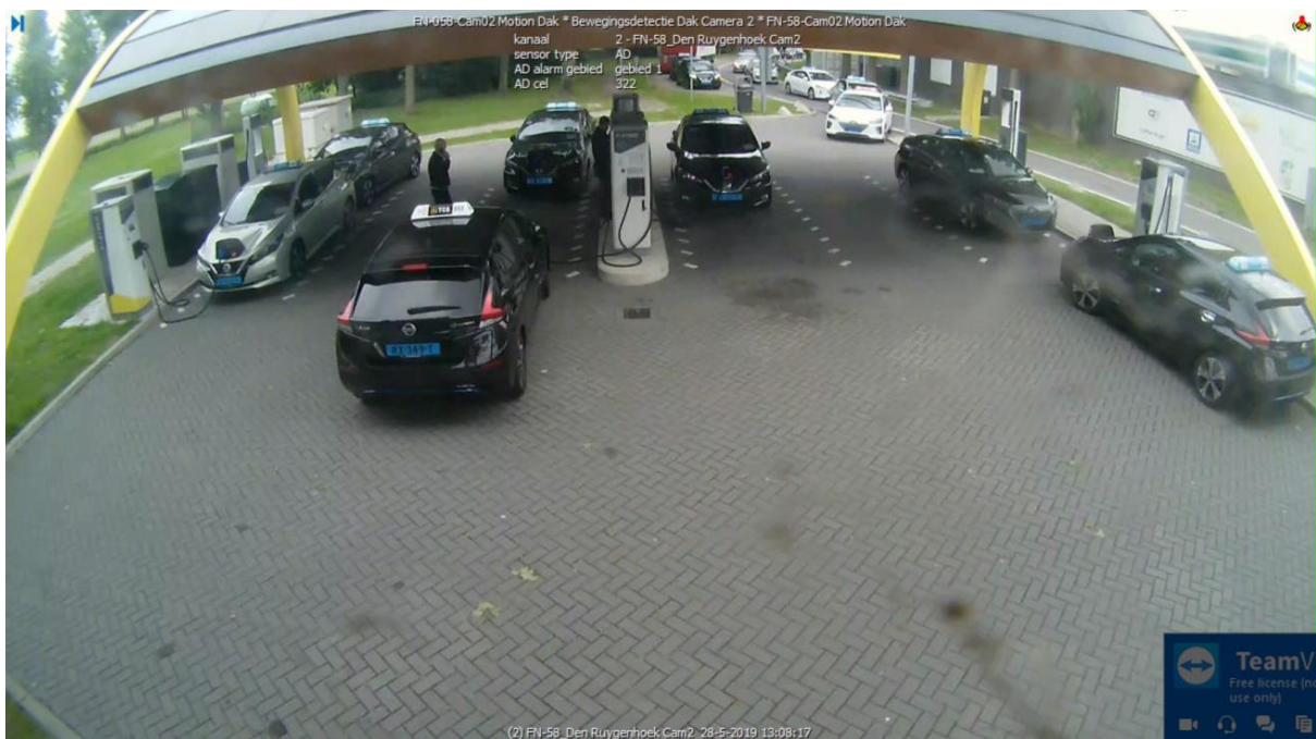
Wachtrij op locatie Ruygenhoek West. Zie ook de geparkeerde voertuigen op de vrachtwagen parkeerstrook.