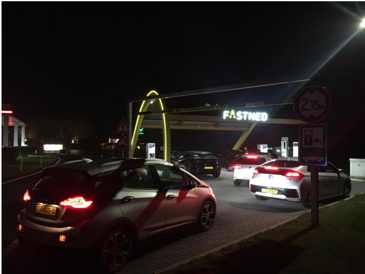
Wachtrij op locatie De Lepelaar. De laatste auto blokkeert de ingang van het laadstation.