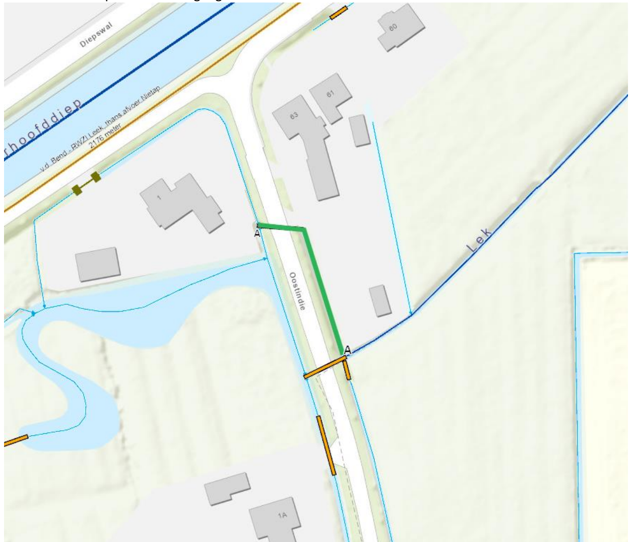
Figuur 2: in groen en met A-A weergegeven af te waarden primaire watergang