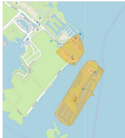
Kaart 2: Recreatiegebied De Potten en het Starteiland (het gebied aangegeven onder nummer 3)