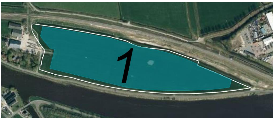
Figuur 1. Weergave projectlocatie (bron: ingediende inrichtingstekening NLD.0067.DEV.M4.001.0.0.).

Het dagelijks bestuur van het waterschap Noorderzijvest heeft op 5 april 2024 van _____, een aanvraag ontvangen om een omgevingsvergunning als bedoeld in artikel 5.1, tweede lid, van de Omgevingswet (Ow). De aanvraag betreft het aanleggen van een hekwerk, het plaatsen van zonnepanelen, het aanleggen van een bouwwerk, het aanleggen van een pad en het aanbrengen van beplanting, nabij Van Starckenborghkanaal Noordzijde te Noordhorn, zoals hieronder globaal is weergegeven in figuur 1 en 2.