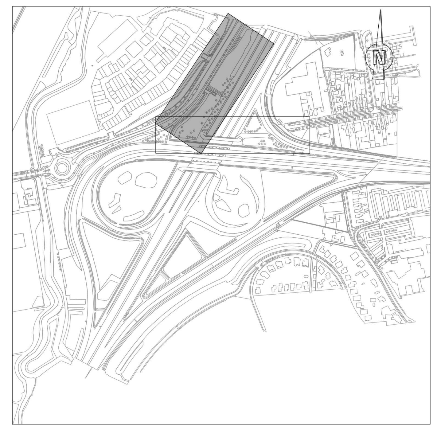
OVERZICHTSKAART SCHALE 1:5000