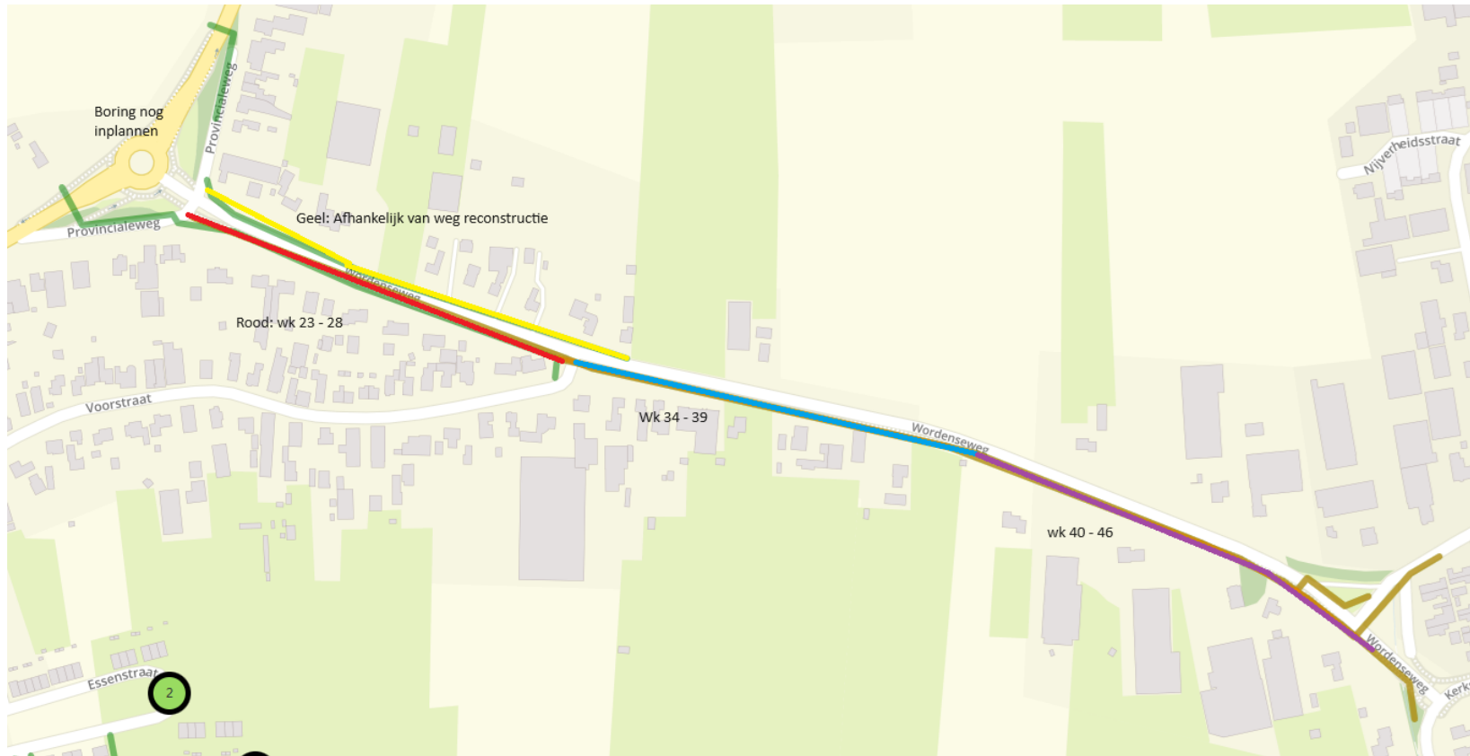
Werkzaamheden en afsluiting Wordenseweg

Tekening behorend bij verkeersbesluit VBK25-2024