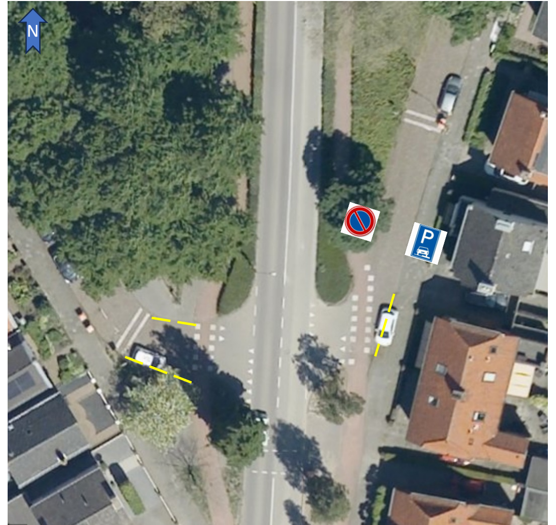
Figuur 2 — Gele, onderbroken markering op trottoirband