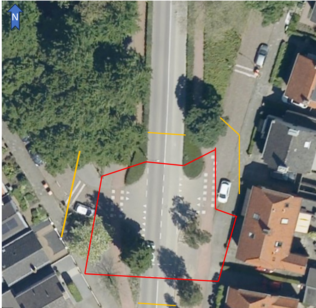
Figuur 1 — Kruisingsvlak — 5 meter vanaf kruisingsvlak