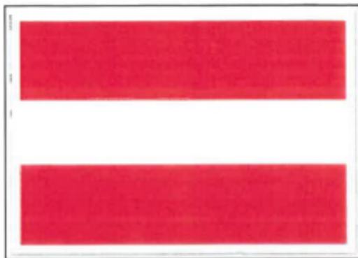
In-, uit- of doorvaart verboden (BPR, bijlage 7, A.I)

Dit bord komt op de volgende locaties te staan: