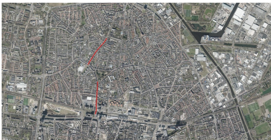
Figuur 2.1: Aanduiding traject

In onderstaande figuur is het onderzoekstraject van de Gasthuisring en het zuidelijk gedeelte van de Goirkestraat globaal weergegeven.