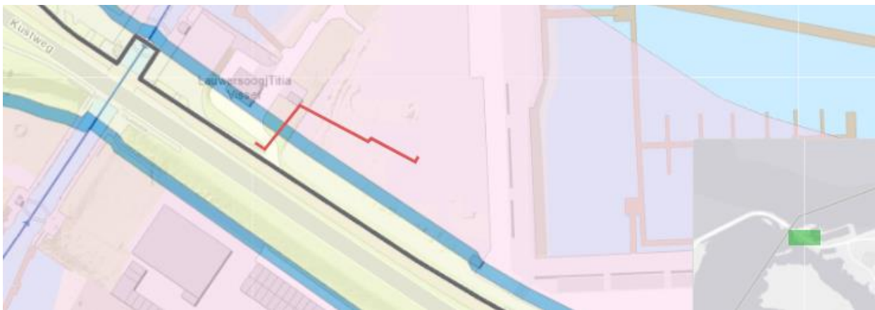
Figuur 1: In het rood het aan te leggen kabeltracé. In het geel, blauw en roze beperkingengebied I, II en III van een primaire waterkering

Het dagelijks bestuur van het waterschap Noorderzijlvest heeft op 16 april 2024 van namens _____ een aanvraag ontvangen om een omgevingsvergunning als bedoeld in artikel 5.1, tweede lid, van de Omgevingswet (Ow). De aanvraag betreft het aanleggen van een glasvezelkabel nabij Kustweg 3 te Lauwersoog, zoals hieronder globaal is weergegeven in figuur 1.