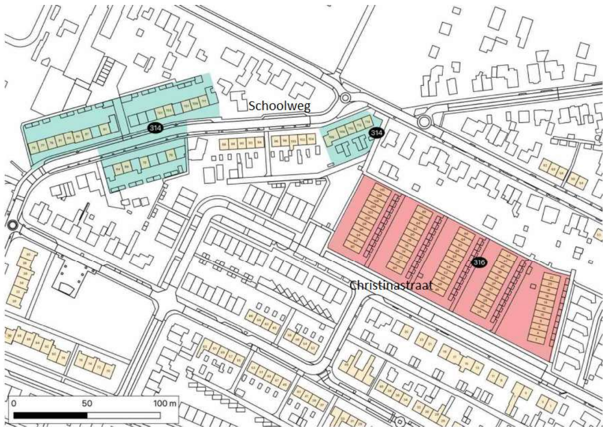
Figuur 1. Ligging betrokken complexen in Elst.