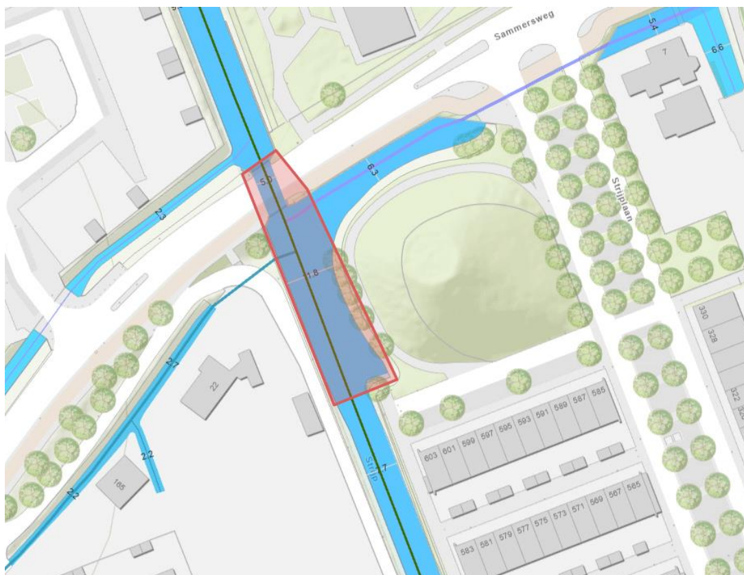
Afbeelding 1: in rood locatie stremming voor al het vaarverkeer

Door het uitvoeren van de werkzaamheden is een veilige en vlotte doorvaart niet mogelijk en wordt de vaarweg ter hoogte van de Sammersweg te Rijswijk volledig gestremd voor al het vaarverkeer.