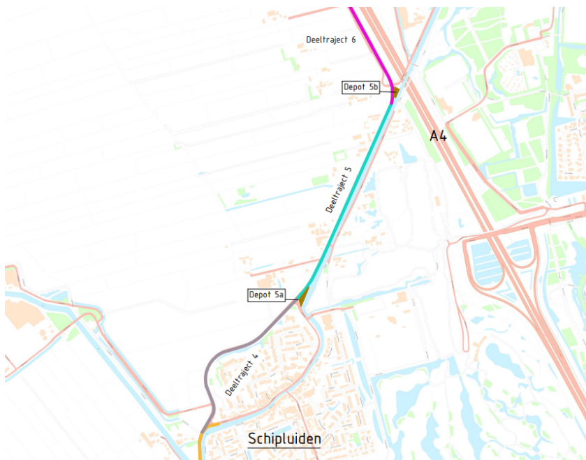
Afbeelding 1, ligging stremming (aangegeven als Deeltraject 5)

De werkzaamheden voor het aanbrengen van de damwanden worden vanaf een ponton uitgevoerd, welke nagenoeg de gehele vaarweg blokkeert. Het is niet mogelijk om tijdens de werkzaamheden het vaarverkeer deze werkzaamheden veilig en vlot te laten passeren. Om deze reden is het noodzakelijk dit gedeelte van De Gaag geheel te stremmen voor al het vaarverkeer.