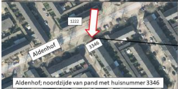
Aldenhof; noordzijde van pand met huisnummer 3346