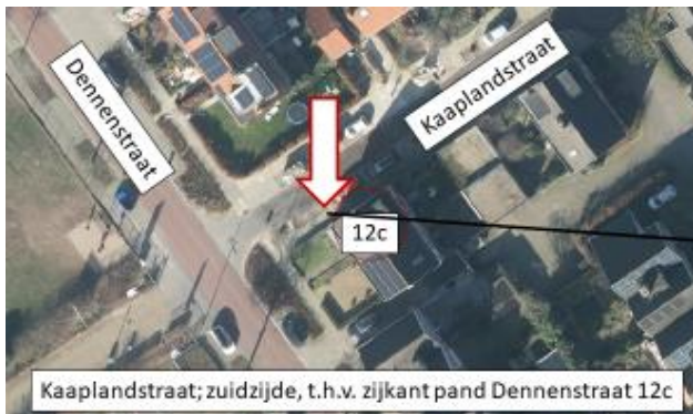
Kaaplandstraat; zuidzijde, t.h.v. zijkant pand Dennenstraat 12c