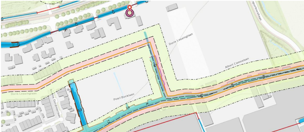
Afbeelding 1: Huidige situatie waterkering