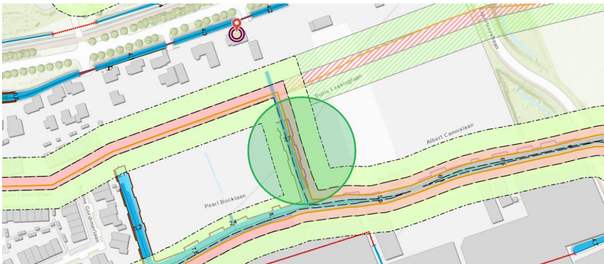
Afbeelding 2: toekomstige situatie, de regionale waterkering ter plaatse van groene cirkel komt te vervallen, gearceerde kering is de toekomstige waterkering.

Deze omgevingsvergunning voor wateractiviteiten vergund de volgende wateractiviteiten: