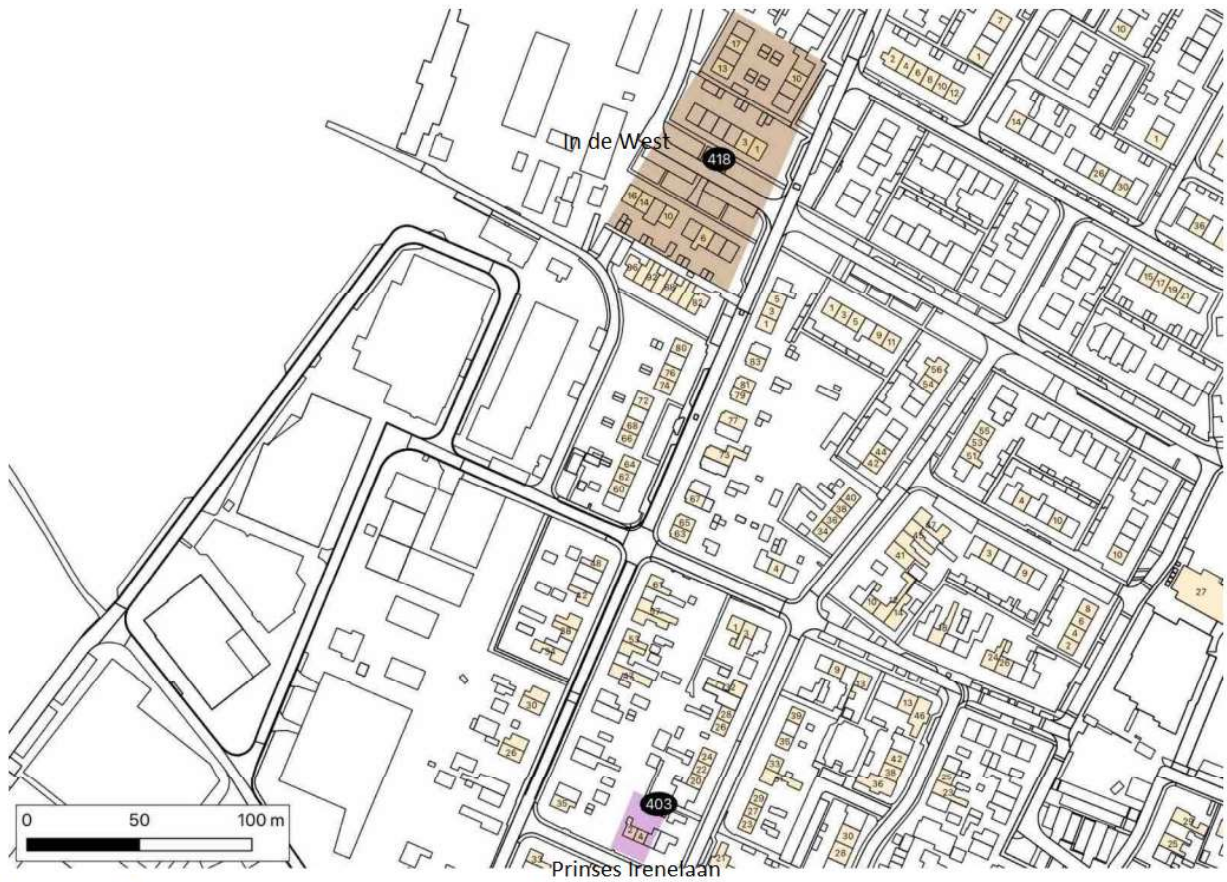
Figuur 1. Ligging betrokken complexen in Amerongen.