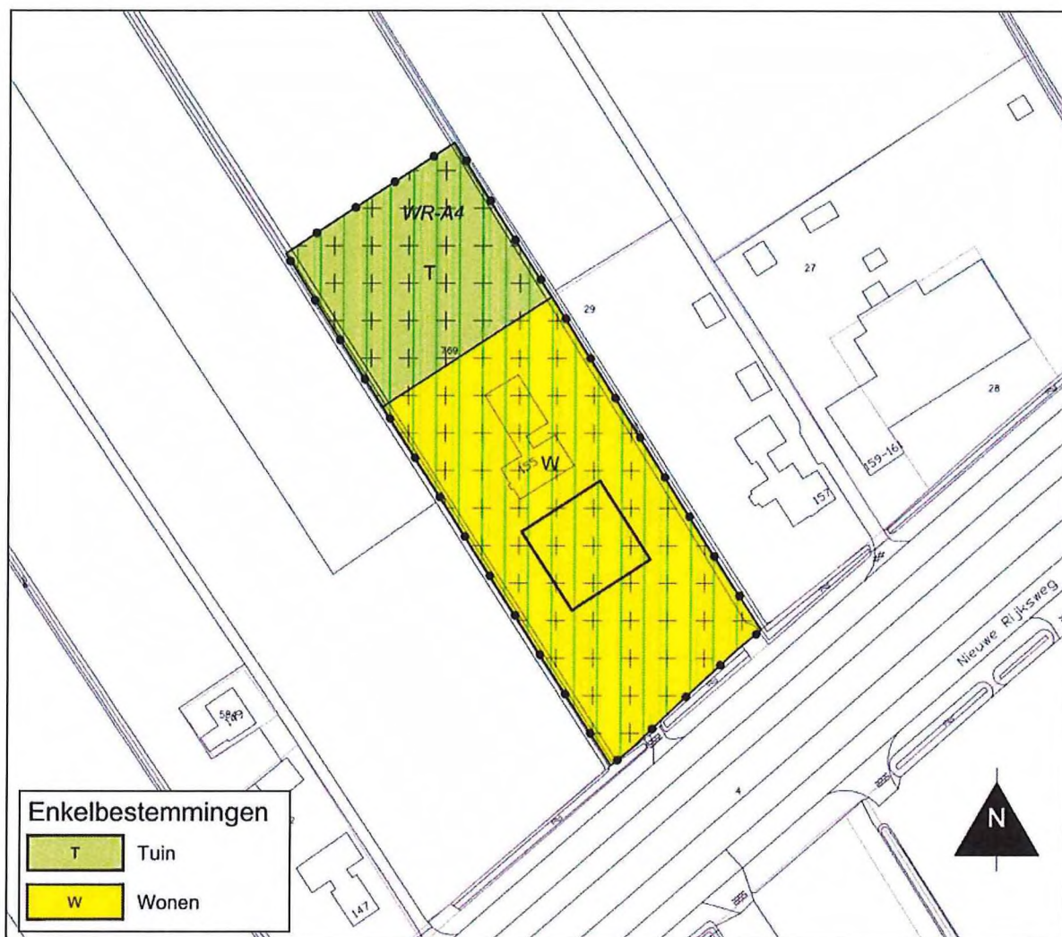
Figuur 1: Uitsnede plankaart