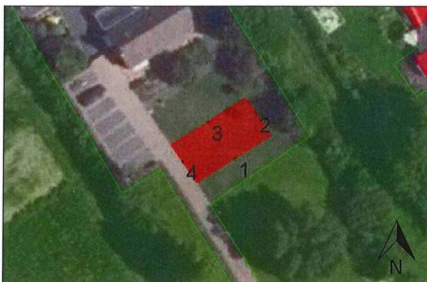
Figuur 2: Ontvangerpunten