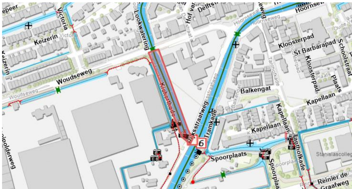
Afbeelding 1: Locatie stremming in rood aangegeven

Aangezien de stremming in het vaarseizoen plaatsvindt en deze vaarweg een belangrijke verbinding vormt in het vaarnetwerk, is besloten een verkeersbesluit af te geven. In dit verkeersbesluit wordt ook de stremming voor een kleiner gedeelte van de Look afgegeven, zodat enkel het gedeelte waar daadwerkelijk de werkzaamheden plaatsvinden gestremd wordt. Het overige gedeelte van de Look is dan bevaarbaar en het scheepvaartverkeer, inclusief kano's, kunnen van dit gedeelte gebruik maken. Wel moet ter plaatse van de kruising van de Look en de Kerstanje / Noordhoornsche Watering een informatiebord worden geplaatst dat de vaarweg ter hoogte van de Woudseweg volledig is gestremd.