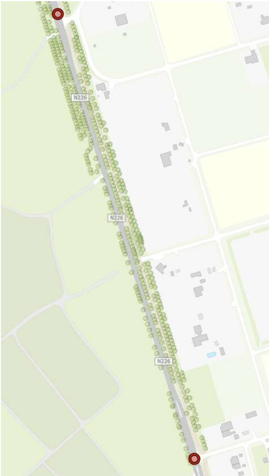
Afbeelding 3: compensatiegebied langs de N226 tussen hectometer 60.6 en 61.2.