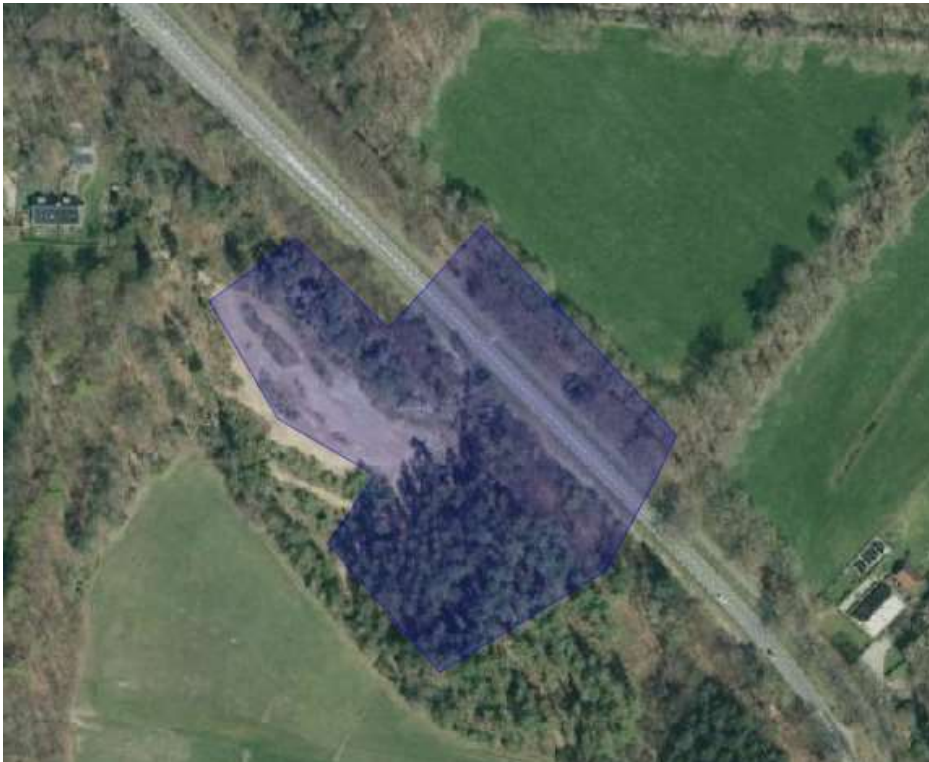
Afbeelding 1: Luchtfoto van de vellingslocatie.

Onderstaand zijn de velling- en compensatielocatie weergegeven die behorende bij het besluit van Gedeputeerde Staten van Utrecht van 25 april 2024, met zaaknummer Z-PU-2024-000349.