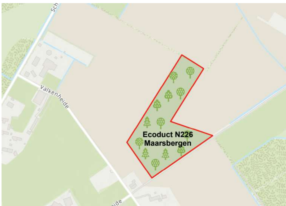
Afbeelding 2: compensatiegebied Valkenheide.