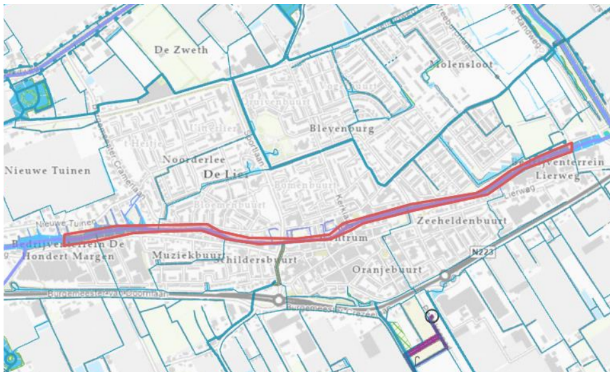
Afbeelding 1: In rood is de stremming aangegeven.

Op 21 augustus 2024 tussen 09:00 tot en met 22:00 uur zal de volledige vaarweg, zoals op onderstaande afbeelding is weergegeven, worden gestremd en moeten er verkeersmaatregelen worden getroffen om de veiligheid van het vaarverkeer te garanderen.