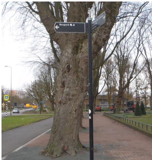
Figuur 4 Uitvoering voetgangersbewegwijzering Alphen aan den Rijn

Voetgangersbewegwijzering is bedoeld om voetgangers in een bepaald gebied (vaak in het centrum) naar de juiste bezienswaardigheden, belangrijke punten en relevante faciliteiten te geleiden.