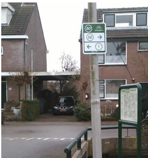
Figuur 3 Uitvoering fietsknooppunten

Naast de borden met de knooppuntnummers zijn er informatiepanelen met een plattegrond en de knooppunten.