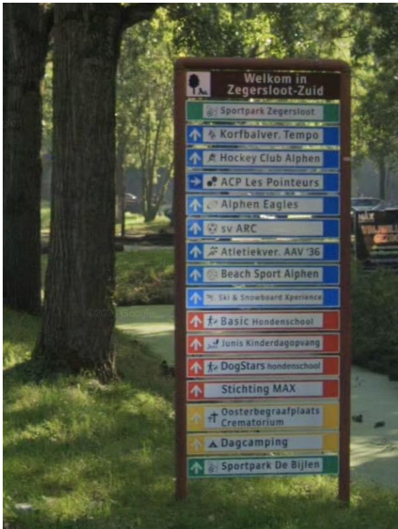
Figuur 3 Uitvoering bewegwijzering Zegersloot