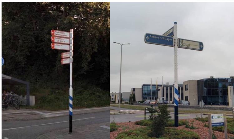
Figuur 1 Uitvoering fietsbewegwijzering en bewegwijzering voor gemotoriseerd verkeer

Bewegwijzering in de categorie K (RVV 1990) verwijst naar geografische locaties of voorzieningen zoals parkeerplaats, tankstation of wegrestaurant. Deze bewegwijzering is ondergebracht bij de Nationale Bewegwijzeringsdienst (NBd). De NBd zorgt voor een duidelijke en uniforme bewegwijzering langs de Nederlandse wegen (snelwegen, provinciale wegen en gemeentelijke wegen) voor het gemotoriseerd verkeer en het fietsverkeer.