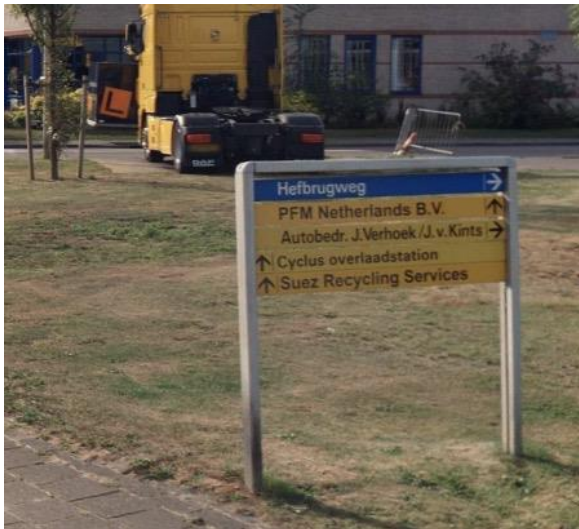
Figuur 2 Uitvoering industriebewegwijzering De Schans

Industrie- en sportterreinbewegwijzering valt enerzijds in de lokale objectbewegwijzering of K-bewegwijzering (verwijzing naar een specifiek industrie/bedrijven- of sportterrein) en anderzijds in specifieke bewegwijzering (verwijzingen binnen het terrein zelf). De wegwijzerborden op een industrie/bedrijventerrein kunnen qua uitvoering per terrein verschillend zijn. Het huidige systeem op de specifieke terreinen wordt uitgefaseerd. In de toekomst is het mogelijk dat een nieuw systeem wordt opgezet maar dit zal door een marktpartij beheerd en onderhouden moeten worden.