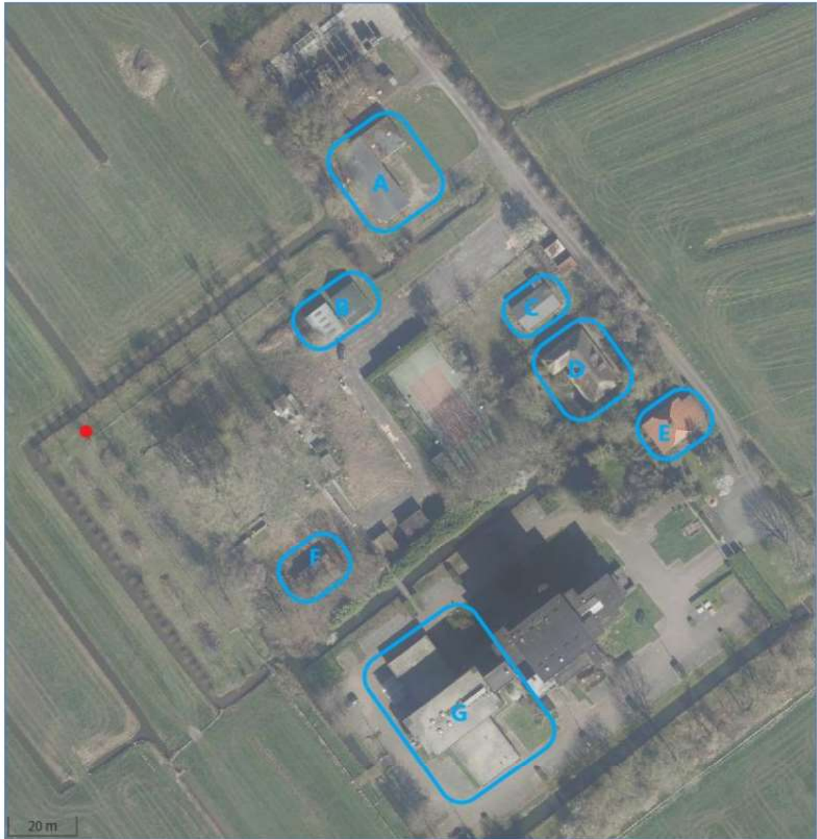
Figuur 1: Het plangebied met in de blauwe kaders de te slopen opstallen en bij de rode stip de locatie van de aangetroffen Heikikker