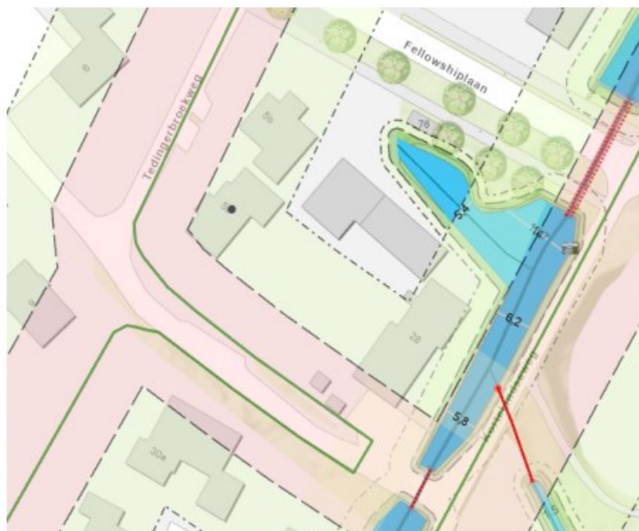
Figuur 1: huidige ligging Polderkade

De verwachting is dat de polderkade op "korte termijn", binnen 10 jaar zal worden opgehoogd en/of verlegd. Het meest te verwachten scenario is dan dat de oude leggerlijn, zoals beschreven in het advies, zal worden hersteld. Hierdoor verdwijnt de "knik" uit de polderkade.