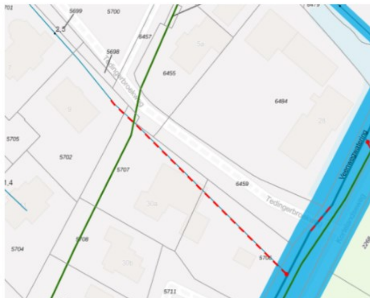
Figuur 2: voormalige ligging Polderkade