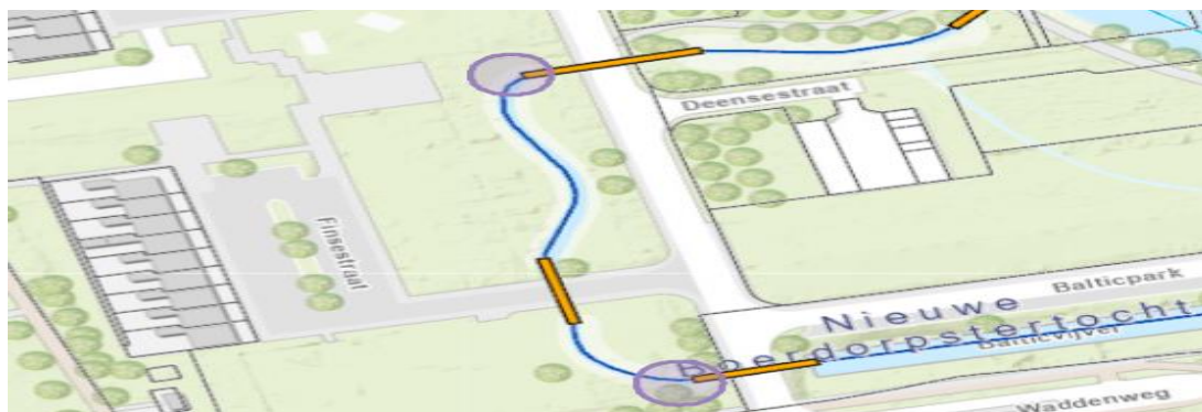
Figuur 3. Te verlengen duikers, weergegeven met paarse cirkels.