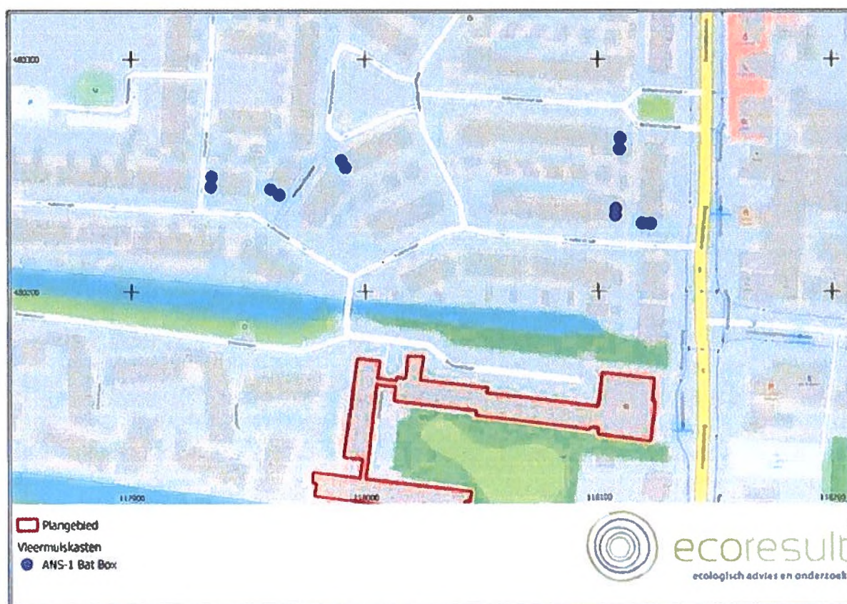
Figuur 1: Locaties tijdelijke alternatieve verblijfplaatsen voor de gewone dwergvleermuis in de vorm van 12 vleermuiskasten (paarse stippen). Gelegen aan de Hovystraat 46, Wilhelminaplein 11 en 6, Wilhelminastraat 1, Amsterdamsestraatweg 127, en de Katerstraat 2.