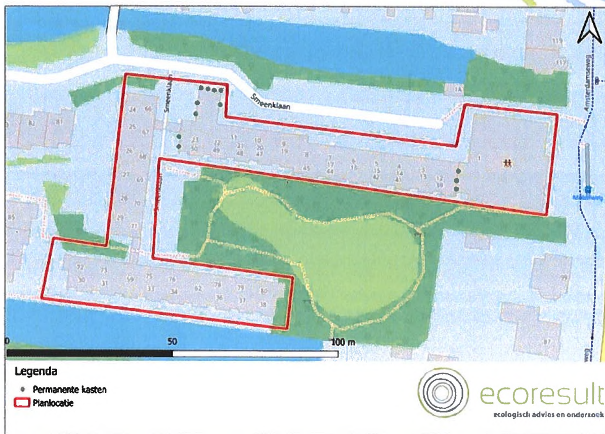
Figuur 1: Locaties van de twaalf permanente alternatieve verblijfplaatsen in de vorm van inbouwkasten (groene stippen).