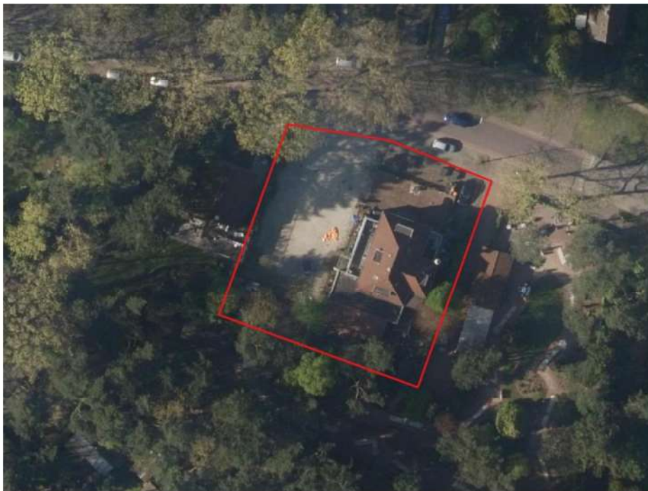
Figuur 2: Luchtfoto van ligging plangebied