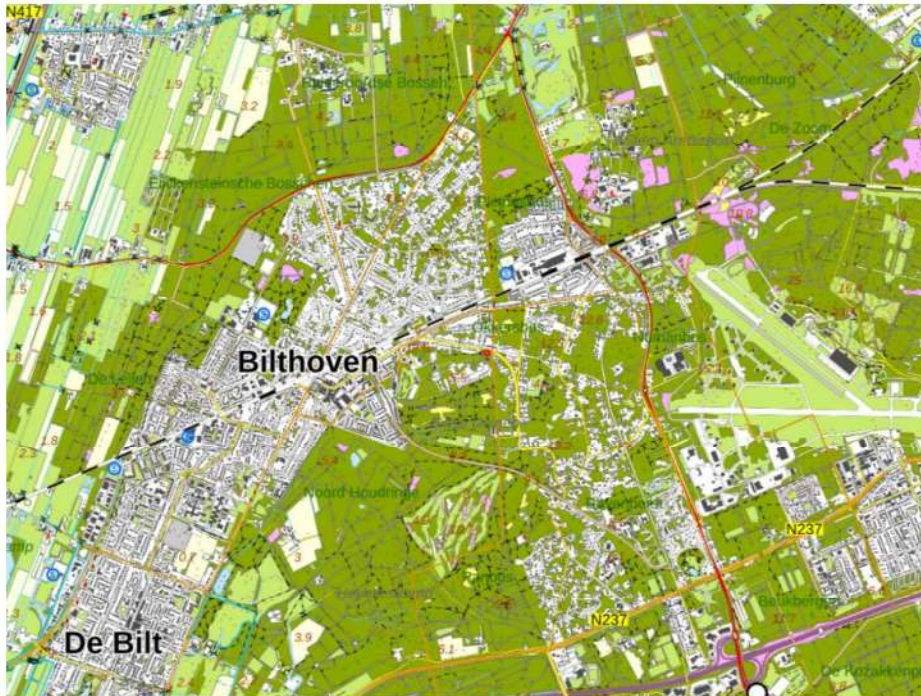
Figuur 1: Topografische kaart van ligging plangebied