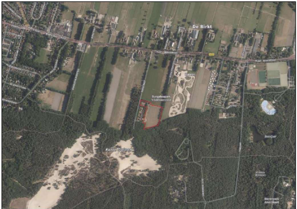
Figuur 1.1 Ligging projectgebied uitbreiding 't Eekhoornnest (rood omlijnd).