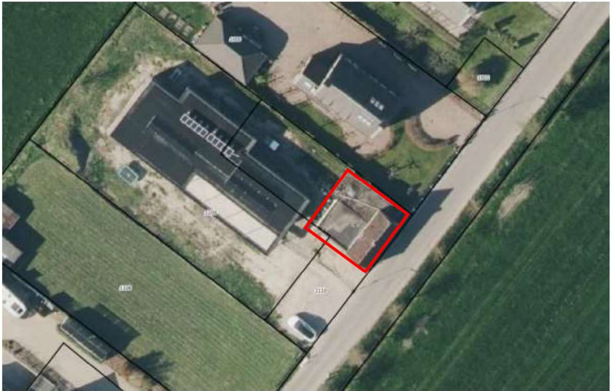
Figuur 1 Ligging plangebied (rood kader) (OpenStreetMap Foundation, 2022)

Bron: "Activiteitenplan gewone dwergvleermuis Wijkerweg 9 3947 NH Langbroek" door MBH Consult B.V. van 20 december 2023