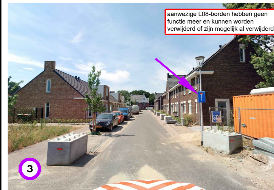
aanwezige L08-borden hebben geen functie meer en kunnen worden verwijderd of zijn mogelijk al verwijderd