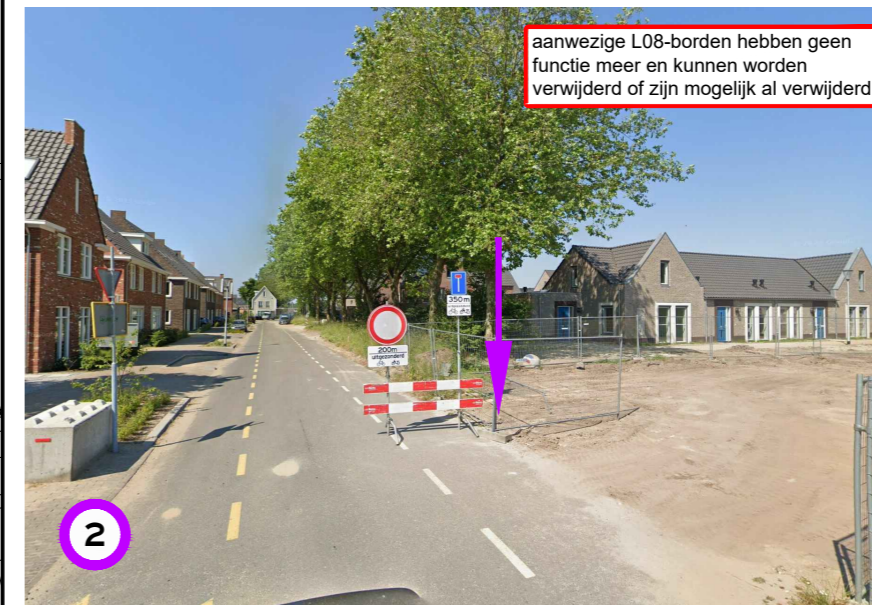
aanwezige L08-borden hebben geen functie meer en kunnen worden verwijderd of zijn mogelijk al verwijderd