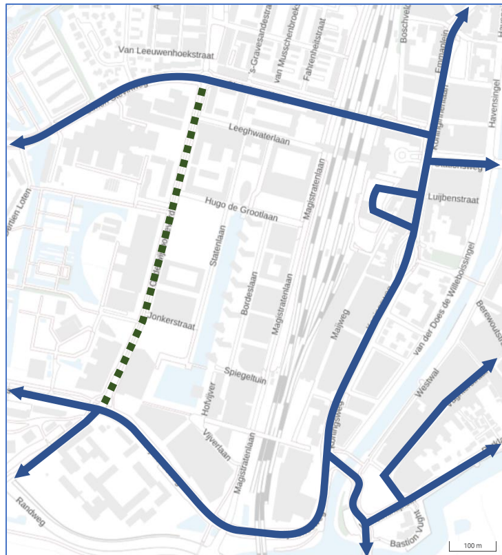
Figuur 1. Ontsluitingsoptie via de Onderwijsboulevard

In dit verkeersbesluit wordt daar vanuit gegaan. Wanneer de inritconstructie in de toekomst wordt aangepast, zal een nieuw verkeersbesluit moeten worden genomen.