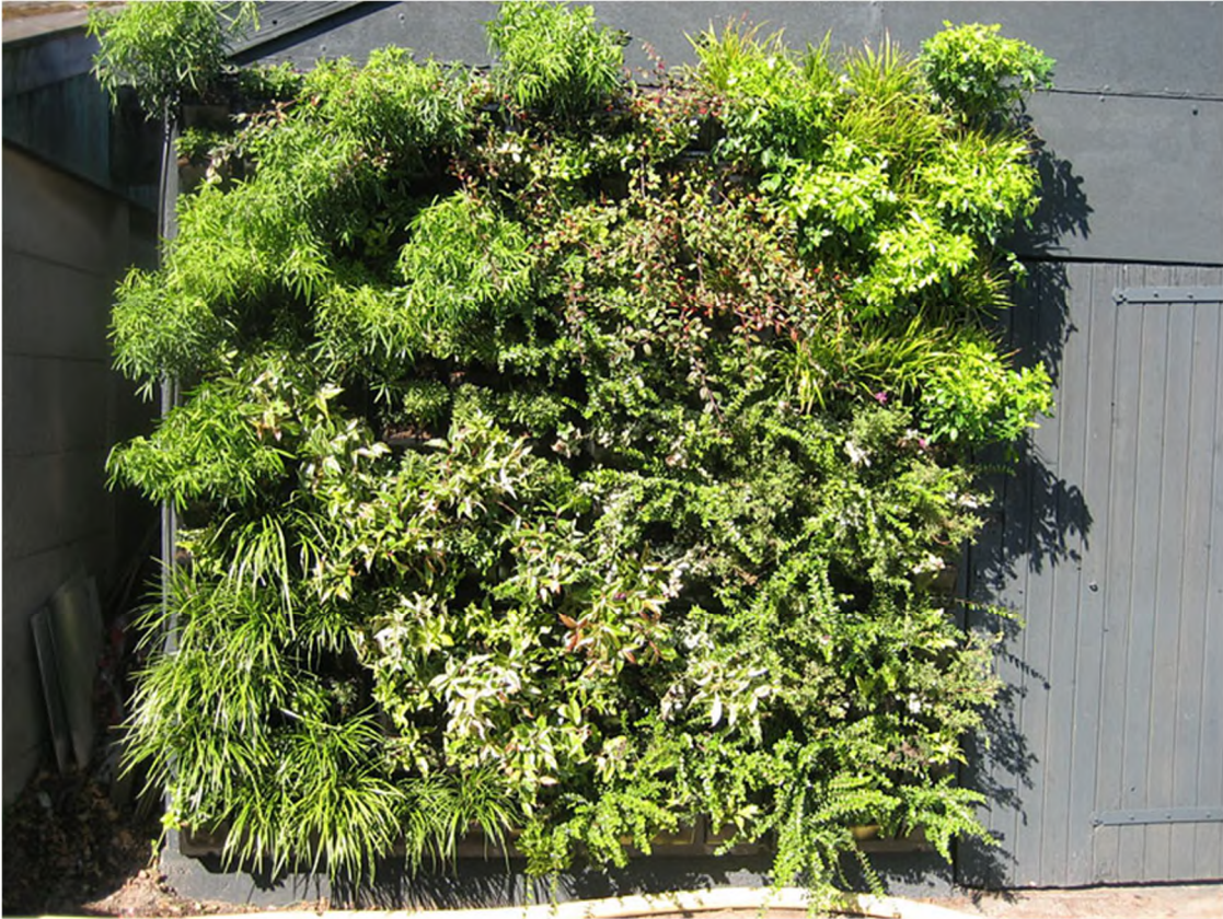
Voorbeeld vergroening op de begane grond