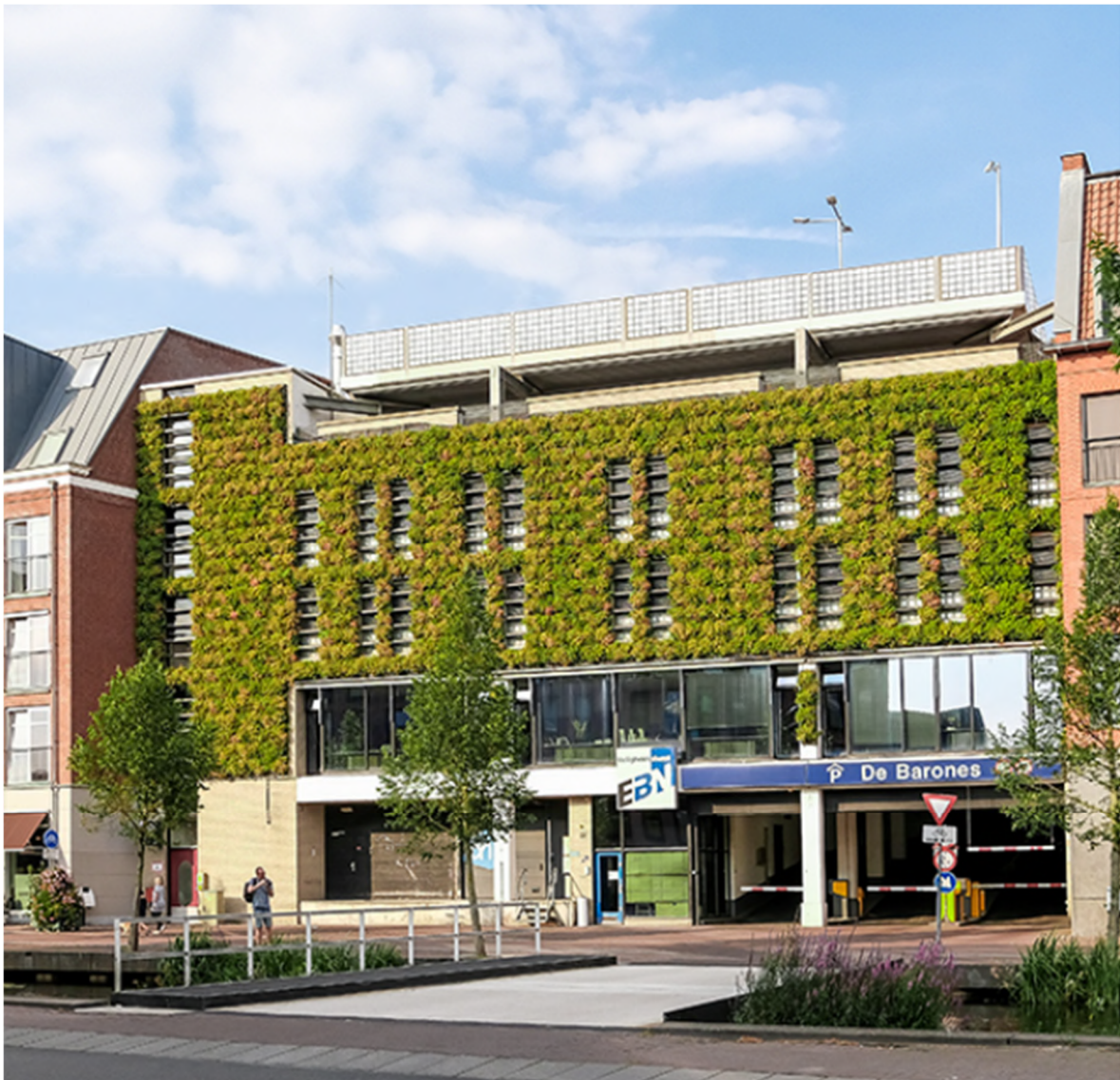
Voorbeeld verticale tuin