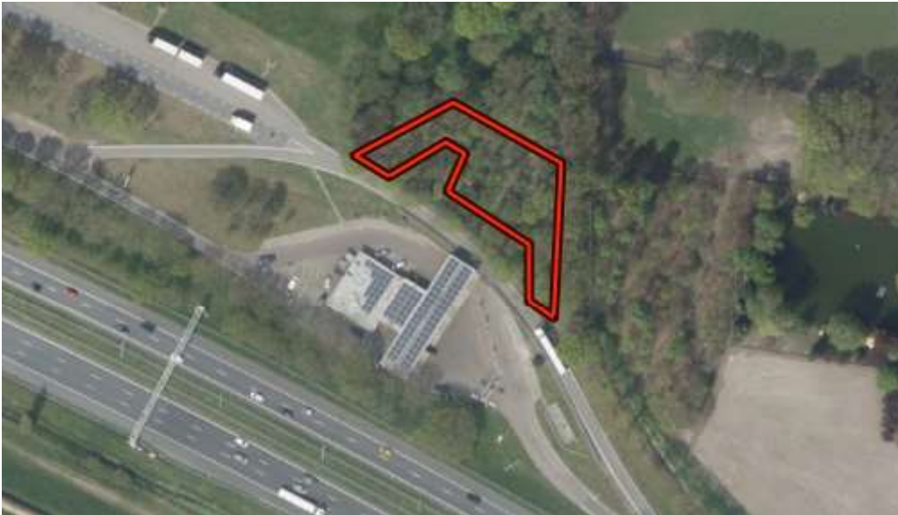
Afbeelding 1: Luchtfoto van de vellingslocatie op verzorgingsplaats Neerduist.

In de onderstaande afbeeldingen zijn de velling en compensatielocatie weergegeven die behoren bij het besluit van Gedeputeerde Staten van Utrecht van 21 maart 2024, met zaaknummer Z-PU-2024-000035.