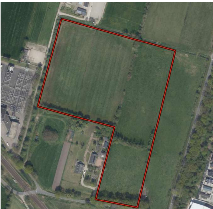
Afbeelding 2: In rood omlijnt het compensatiegebied wat onderdeel uit gaat maken van natuurgebied Melksteeg.