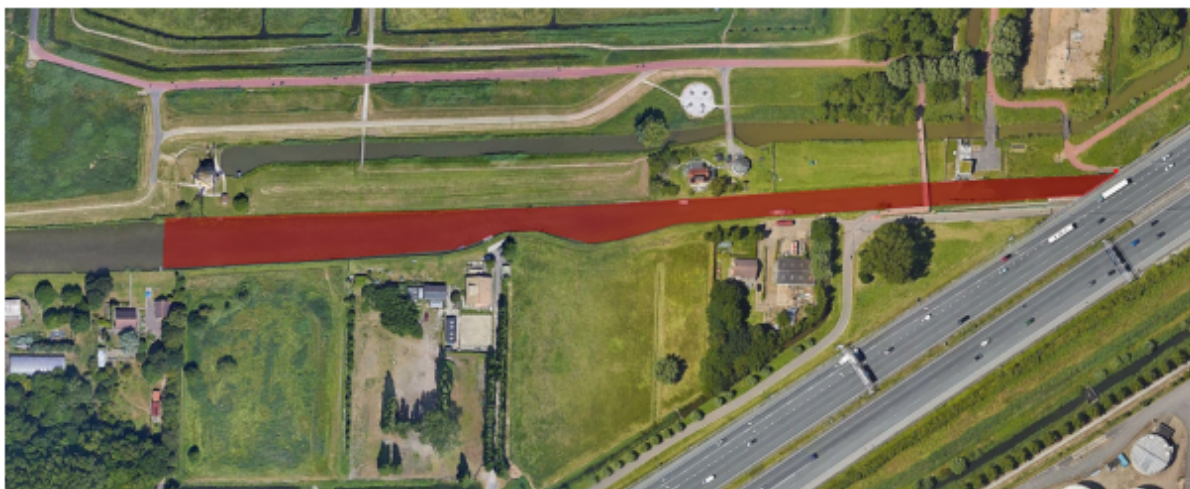
Afbeelding 1: locatie stremming

Doordat de methode is gewijzigd en de werkzaamheden binnen het vaarseizoen plaatsvinden, is besloten een verkeersbesluit af te geven.