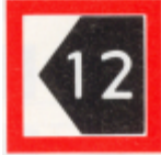
Bord C5, aangeven hoeveel meter de vaarweg vanaf de oever wordt verplaatst.

Van 15 april 2024 tot en met 30 april 2024: