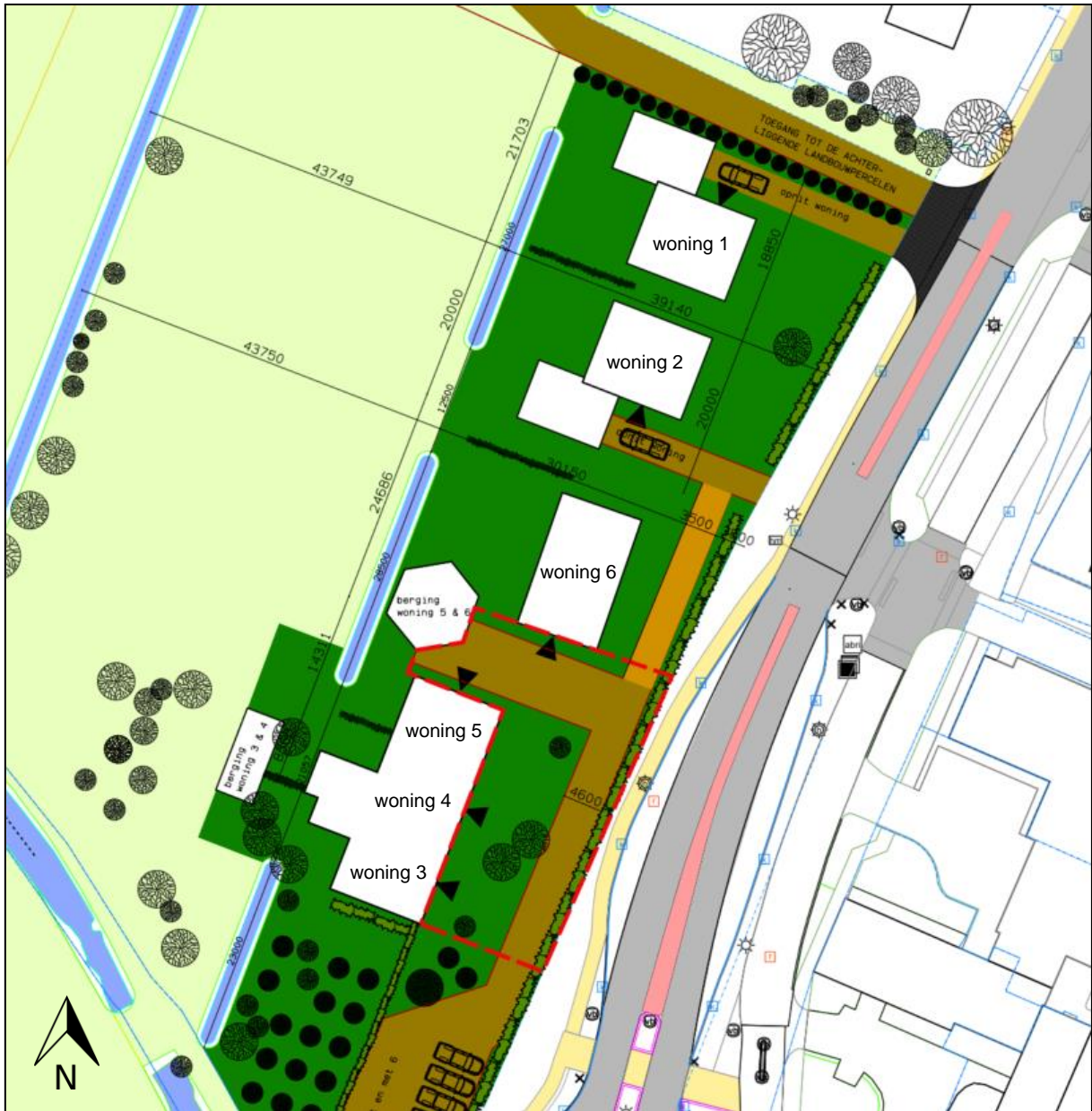
Figuur 2: Inrichtingsplan d.d. 1-11-2023